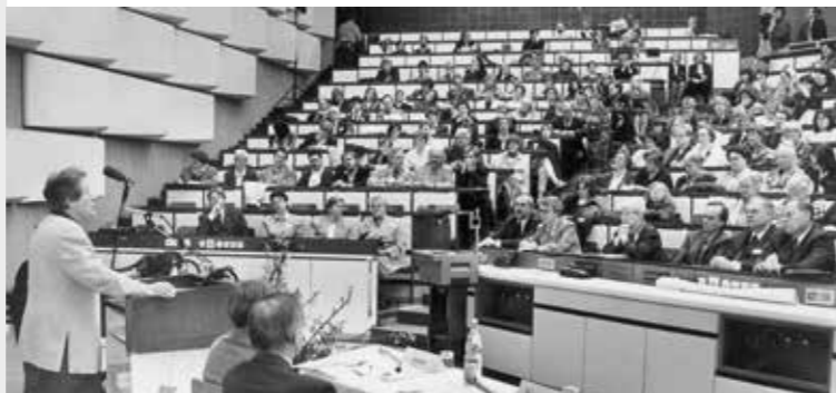
Frauentag, Universität Tübingen, 1999